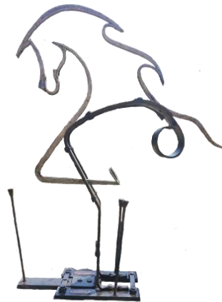
Oeuvre réalisé en 2012 par les Forgerons