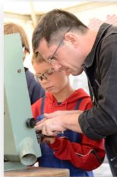
La Confrérie du "Couté de tié"