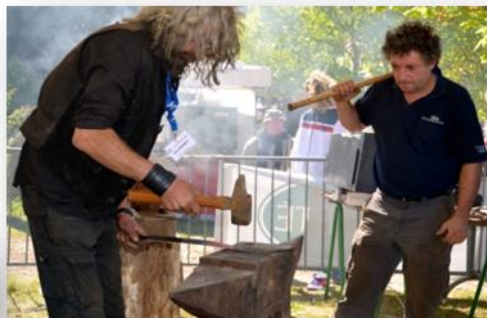
Les forges de Pyrène