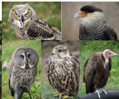
Spectacle de fauconnerie