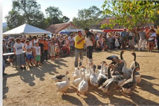
Démonstration de chiens de troupeaux