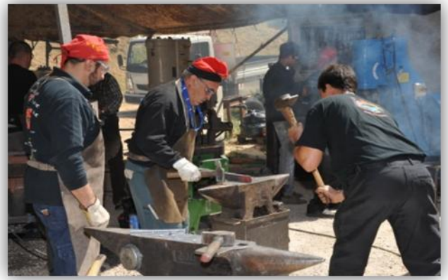
Les Forgerons Catalan