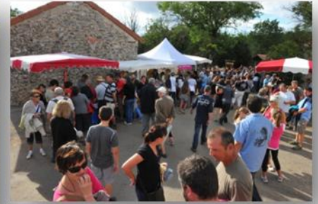
Le marché de pays