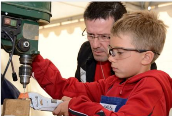
Démonstration et Mini Stage par la confrérie du Couté de Tiè